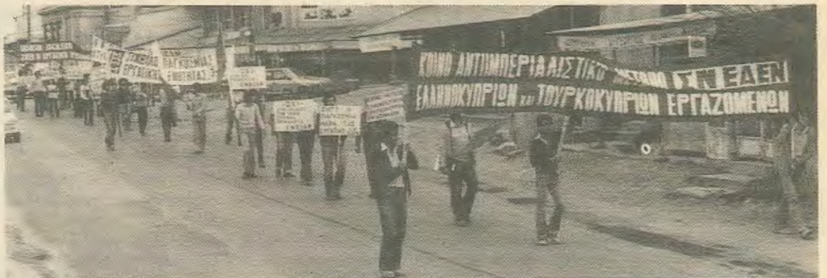
Απο παλιότερες κινητοποιήσεις της Σ.Ν. ΕΔΕΝ όταν το Κόμμα και η Νεολαία είχαν σαν κύριο σύνθημα τους το Ενιαίο Μέτωπο Ε/Κ και Τ/Κ εργαζομένων.

Απο την άλλη το ΑΚΕΛ βλέπει πως το στρατιωτικό ισοζύγιο δεν μπορεί ν' αλλάξει αλλά αρνείται να δει πως